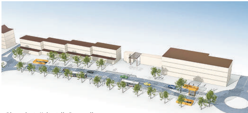
Die geplante Haltestelle Dannerallee an der Manshardtstraße

770 BÄUME müssen gefällt werden/Ersatzverkehr