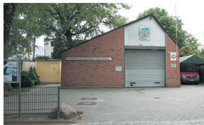
Das Feuerwehrhaus in Kirchsteinbek ist marode. Es sollte auf dem Marktplatz neu gebaut werden, aber Anwohner sind dagegen

Doch die Suche nach einem geeigneten Standort gestaltet sich schwierig. Schon 14 Grundstücke wurden aufwändig geprüft. Schließlich kam der Standort Marktplatz Kirchsteinbek in die engere Wahl. Das Bezirksamt prüfte und plante. Nach langem Hin und Her war man sich endlich einig, dass dies der richtige Standort war. Im Februar sollte hier die Grundsteinlegung sein. Nun mussten noch die Anwohner be-