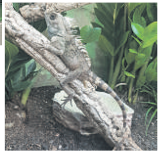
Seltene Tierarten sind noch bis zum 9. Juni im Foyer unten in der Einkaufshalle im Quarree zu sehen.