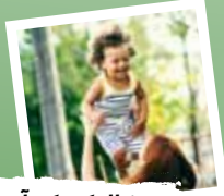
دنبال کودک آمدن