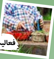
فعالیتها در فضای باز