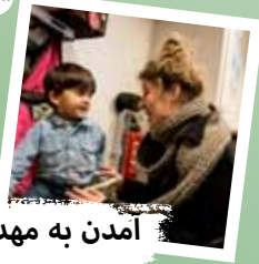
آمدن به مهد کودک