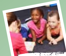
بازی و یادگیری