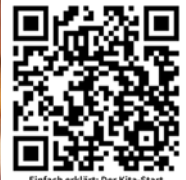
Einfach erklärt: Der Kita-Start