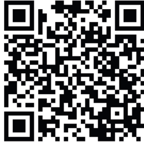
Інформація про дитячі садки для батьків